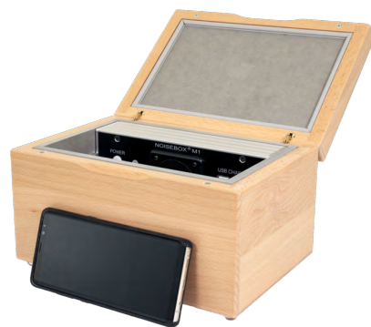
NoiseBox M1 mini