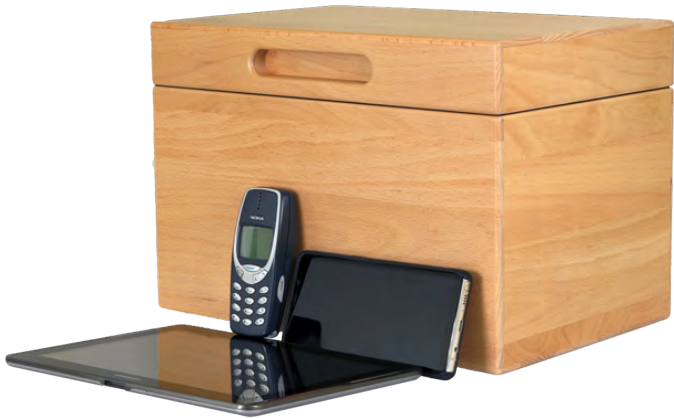
NoiseBox® A2 bok/beechwood