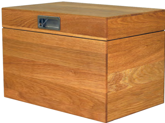
NoiseBox® E1 ek/oak