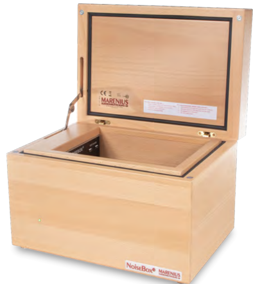
NoiseBox® S1/S1+ bok/beechwood