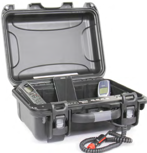
NoiseBox P1 portable