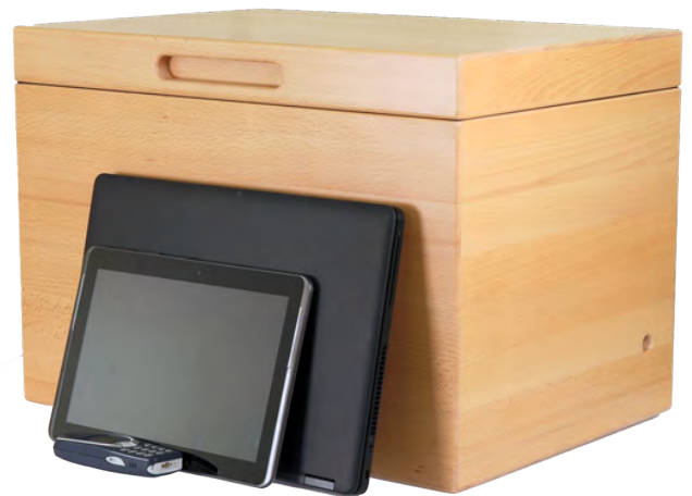
NoiseBox® W1 wide bok/beechwood